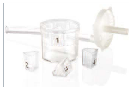
Pojemnik zbiorczy ADVANTAGE POLYP TRAP® (czterokomorowy)