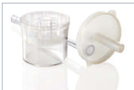
Pułapka na polipy ECONOTRAP® Pułapka na polipy jednokomorowa