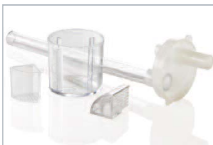
Pułapka na polipy ECONOTRAP® Pułapka na polipy dwukomorowa