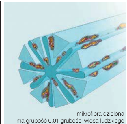
mikrofibra dzielona ma grubość 0,01 grubości włosa ludzkiego

Użycie w pomieszczeniach do odkażania w celu oczyszczenia kanałów endoskopu. Kompatybilne typy endoskopów obejmują m. in.: endoskopy G/I, EUS i bronchoskopy.