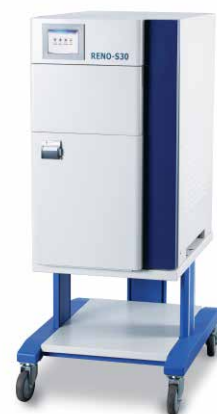
wózek z blokowanymi kółkami (opcja)