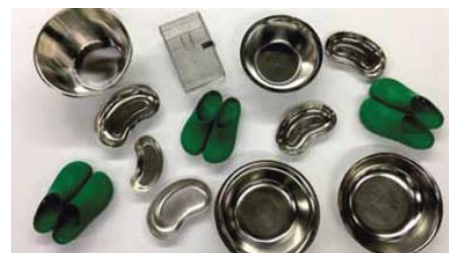
przykład możliwego załadunku