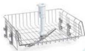
górny kosz - standard